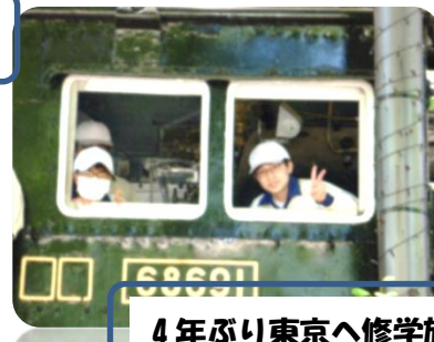
4年ぶり東京へ修学旅行