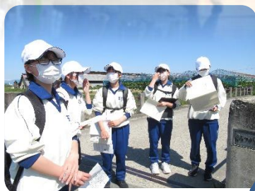
1年生校外学習 習事前準備も 頑張りました