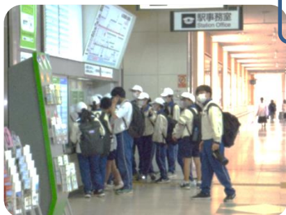
2年生校外学習 絵ハガキの旅より

進取果敢のスローガンのもと、皆さんと共に勇気溢れる学校にしていきたいと思いました。